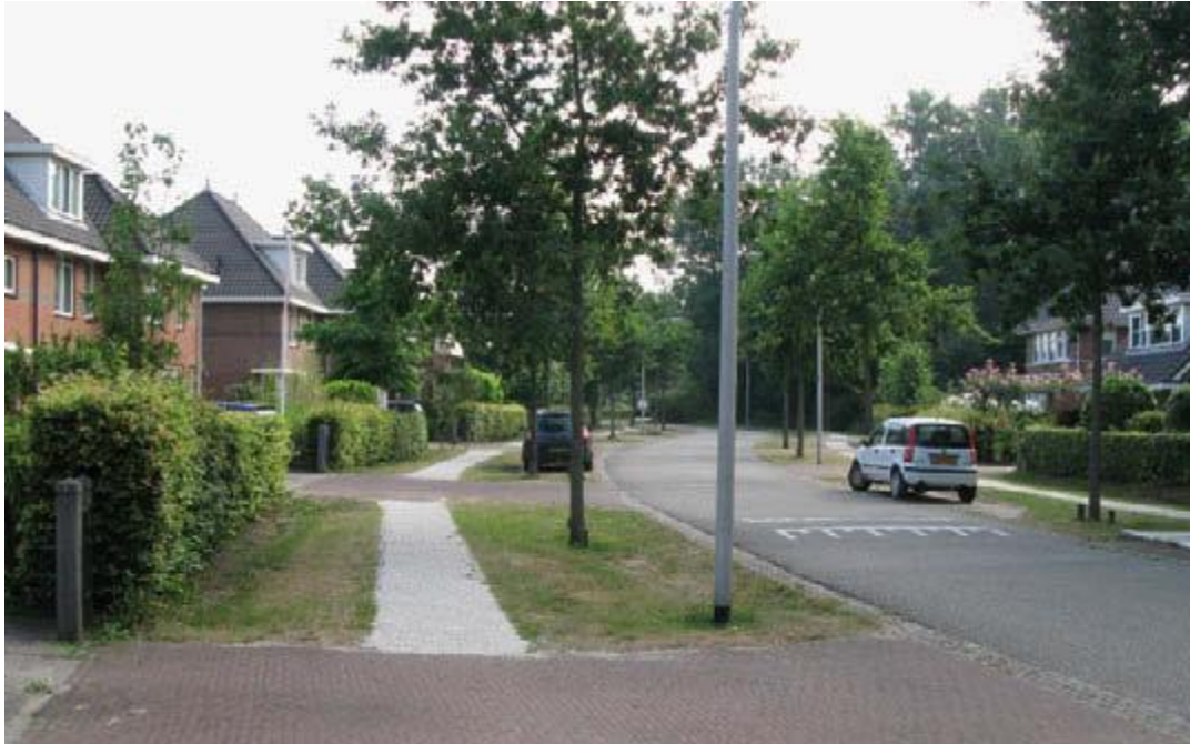
Die Bürger über die Lage aufklären, ist sehr wichtig

Privatpersonen, die vom Eichenprozessionsspinner befallene Bäume besitzen, sind selbst für die Bekämpfung verantwortlich. Die Durchführung der Bekämpfungsmaßnahmen sollte jedoch nicht an Privatpersonen übertragen werden, da die Gefahr besteht, dass diese unsachgemäß ausgeführt wird. Verwalten wird empfohlen, auch auf angrenzenden Privatgrundstücken (eventuell gegen eine Vergütung) die Nester zu beseitigen. Das Anwenden biologischer Mittel, die unter das Pflanzenschutzgesetz fallen, wie zum Beispiel Bakterienpräparate, ist auf Privatgelände nicht erlaubt. Hierzu gibt es momentan keine Zulassung.