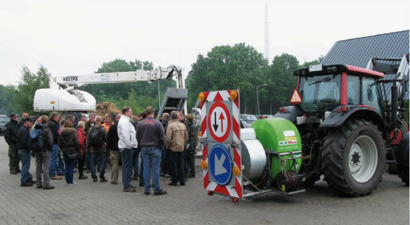
Feldarbeit über den Eichen-Prozessionsspinner in Diever, Niederlande, organisiert von der Arbeitsgruppe "Kenntnisse der Natur der Forstverwaltung", Juni 2012