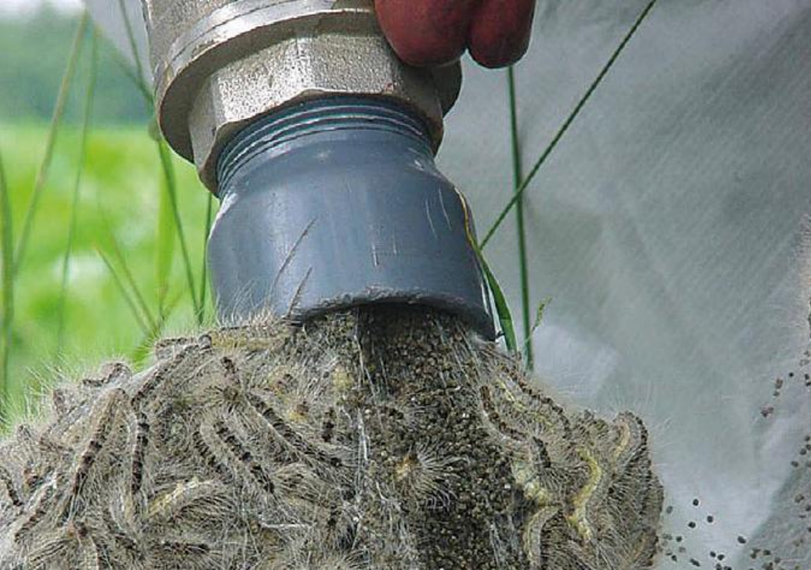
Mechanische Beseitigung von Nestern und Raupen durch Einsaugen in ein Jauchefass, einen Container oder in eine Veraschungsvorrichtung