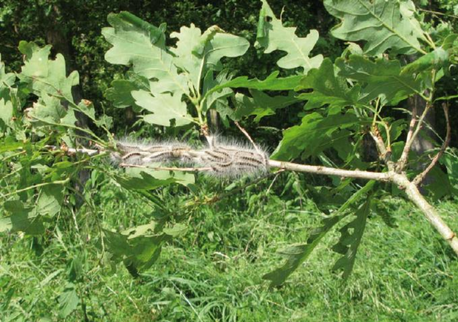
Eichen-Prozessionsspinner im fünften Stadium