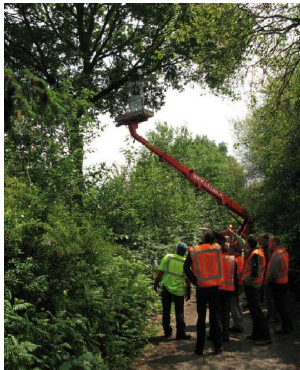
Austausch von Kenntnissen: Mitarbeiter von Provinzen und Gemeinden in Drenthe sind auf Arbeitsbesuch bei der Provinz Noord-Brabant und der Gemeinde Helmond.

An der Evaluierung können verschiedene Parteien beteiligt sein. Die Eindämmung liegt nämlich nicht nur in der Verantwortung der Abteilung für öffentliche Grünanlagen, sondern auch in der Abteilung für Volksgesundheit sowie in der Abteilung, die zuständig für Natur und Landschaft ist. Treten Sie in Kontakt mit anderen Gebietsverwaltern, die ebenfalls mit dieser Problematik zu tun haben, beziehen Sie die regionalen Gesundheitsdienste mit ein und tauschen Sie Erfahrungen aus. Eine effiziente Vorgehensweise im nächsten Jahr wird nämlich auch von einer guten Zusammenarbeit in der Region bestimmt.