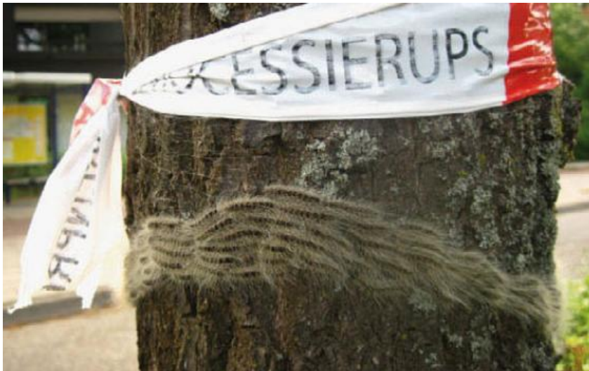
Warnen der Öffentlichkeit und Markierung für künftige Aktion