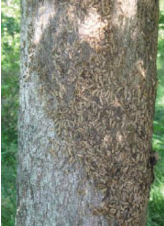
Hohe Konzentration an Häuten des Eichen-Prozessionsspinners