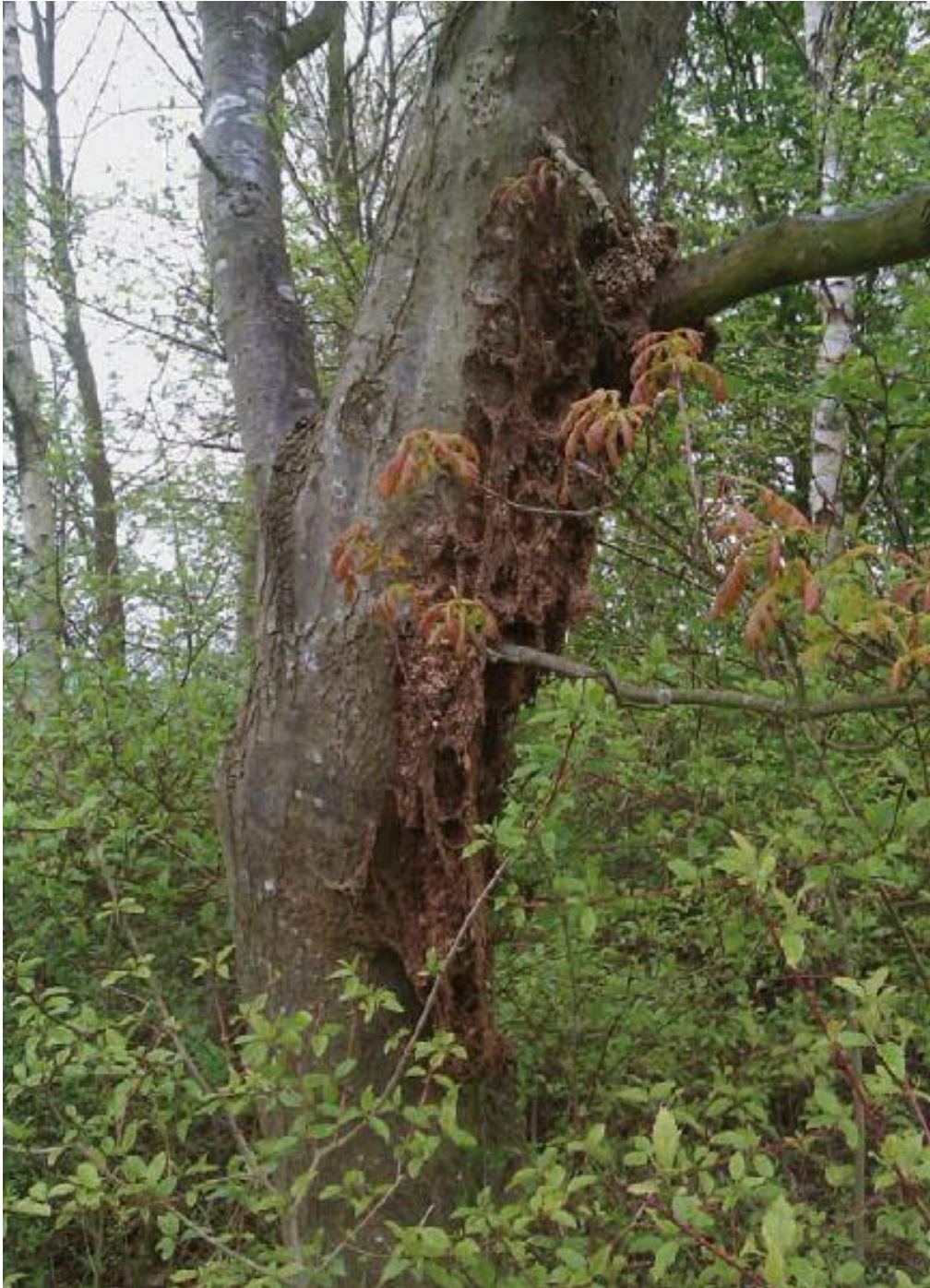
Rückstände von Nestern aus vorangegangenen Jahren

Es ist wichtig, möglichst viele Nester zu entfernen, bevor die Schmetterlinge ausfliegen. Auf diese Weise kann einer Zunahme der Raupenanzahl im nächsten Jahr vorgebeugt werden. Auch ist es sinnvoll, die leeren Nester zu entfernen, da diese immer noch ein Restrisiko darstellen, zum Beispiel bei Wartungsarbeiten an den Bäumen. Da manche Auftraggeber Sparmaßnahmen anstreben, verzichten sie auf den Einsatz einer Hebebühne und beschränken sich auf die Beseitigung der Nester, die sich unterhalb einer bestimmten Maximalhöhe befinden. Es hat sich jedoch herausgestellt, dass man den Problemen damit nur unzureichend begegnet. Die Schmetterlinge aus den zurückgebliebenen Nestern sorgen wieder für Nachkommenschaft und somit für einen neuerlichen Raupenbefall im nächsten Jahr.