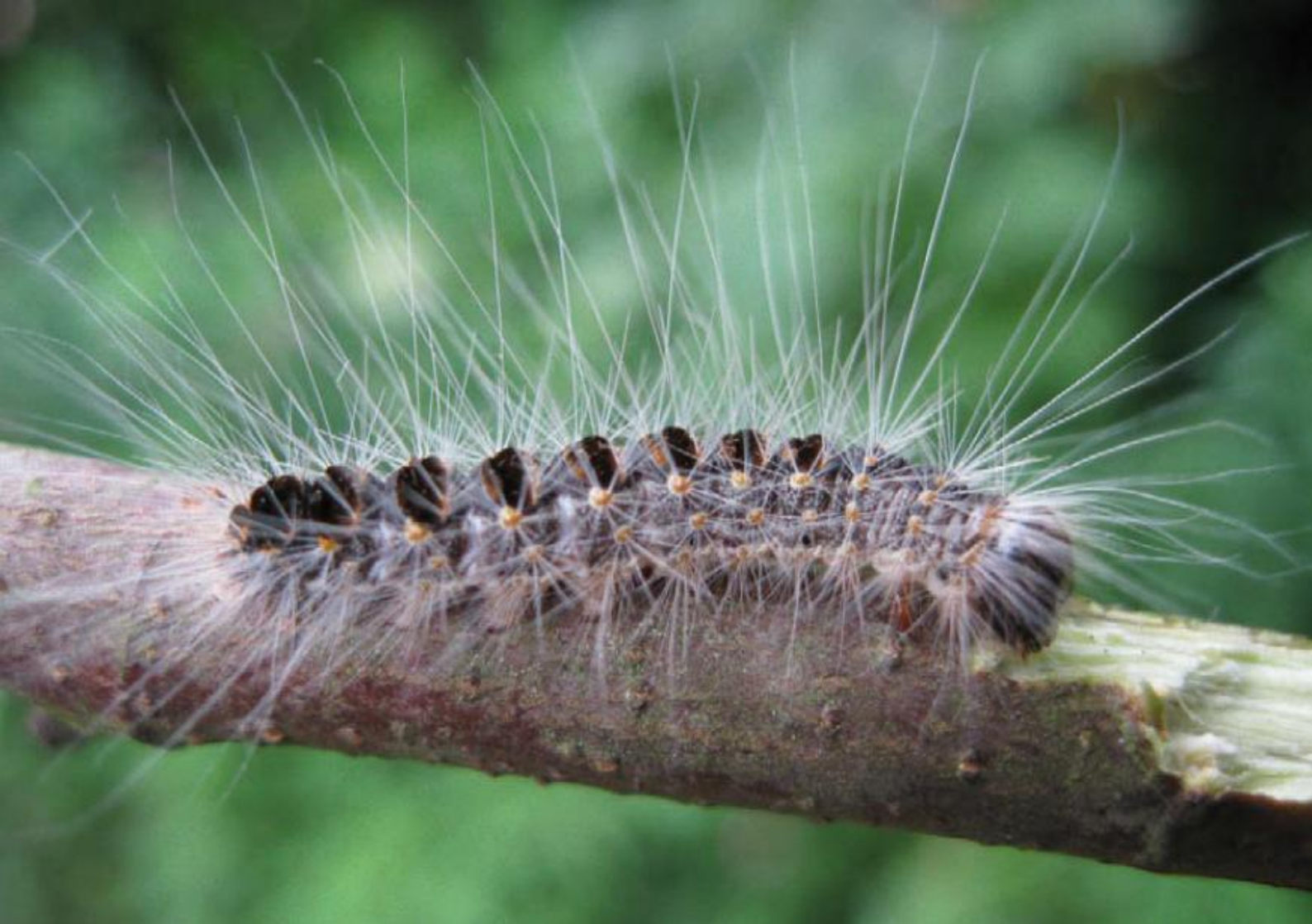
Eichen-Prozessionsspinner im sechsten Stadium mit dunklen Bürsten mit Brennhaaren und langen, nicht-reizenden Haaren.