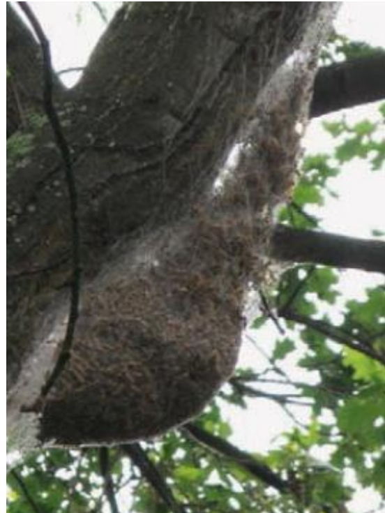
Großes Nest mit Häuten weist auf eine große Zahl von Eichenprozessionsspinnern hin