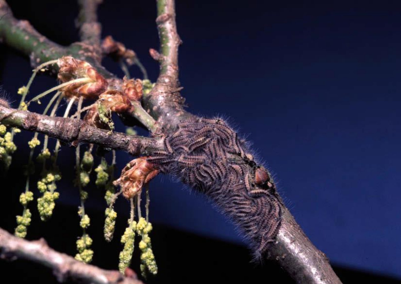
Frisch geschlüpfte Eichen-Prozessionsspinner aus dem ersten Stadium bleiben dicht beieinander und bewegen sich in Prozession