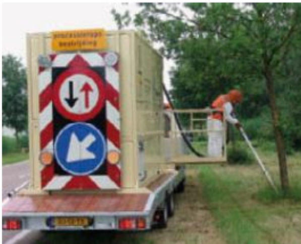
Absaugen und Veraschen: das 'Raupenkrematorium'

Anhand der Entscheidungsfaktoren in Tabelle 5 kann der Verwalter mithilfe der Risiko-Analyse und der Ergebnisse der Beobachtungsphase eine Entscheidung über die Maßnahme(n) treffen, mit denen der Eichenprozessionsspinner bekämpft wird. In Kapitel 3.4 wird ein Schema für die verschiedenen Situationen und die dazugehörigen Maßnahmen gezeigt.