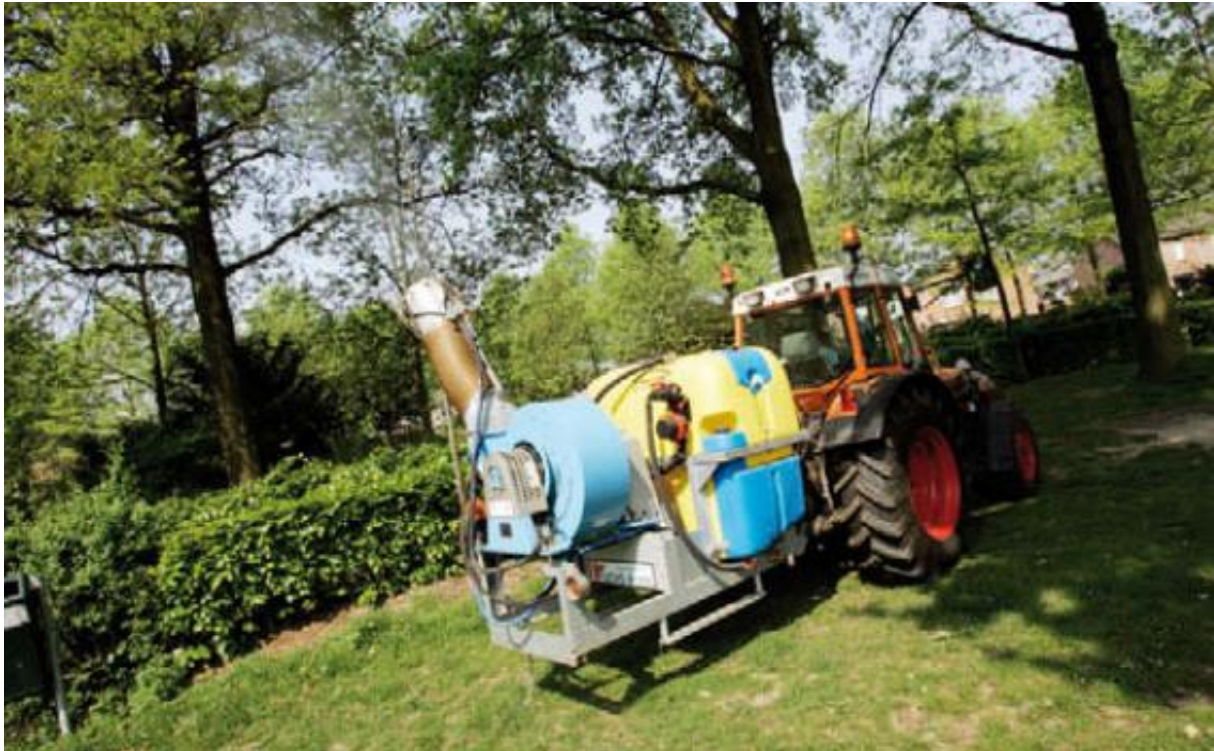
Baumnebelspritzeinheit für das Vernebeln von Bt-Präparaten

für eine effektive Abtötung ausreichend. Bei höheren Bepflanzungen und in Infektionsherdgebieten 13 kann die Behandlung innerhalb von circa zehn Tagen nach der ersten Behandlung wiederholt werden, es sei denn, es lässt sich nachweisen, dass die Raupen in ausreichendem Maße abgetötet worden sind. Das biologische Mittel reagiert empfindlich auf Regen und auf den Einfluss von UV-Strahlung. Es empfiehlt sich, die Vernebelungsbehandlung an Tagen, an denen im Tagesverlauf eine Temperatur von zumindest 15°C erreicht wird, auszuführen. Raupen sind dann - auch nachts bei Temperaturen unter 15°C - gefräßiger und nehmen somit an diesen Tagen mehr Blätter mit dem Bt -Insektizid auf. Dabei darf nicht zu viel Wind wehen (durchschnittlich vorzugsweise weniger als 3 m pro Sekunde), um die Verdriftung zu beschränken. Die Behandlungen können auch nachts ausgeführt werden (weniger Menschen anwesend; relativ windstill). Im Hinblick auf die Umwelthygiene ist Spritzgranulat benutzerfreundlicher als Spritzpulver, da sich dies besser mit Wasser vermischt.