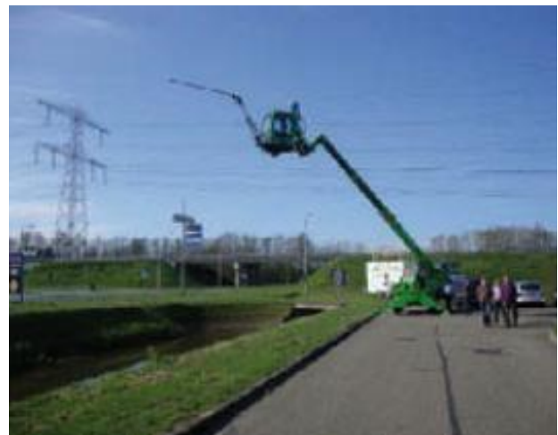
Der "Bugbuster", eine neue Entwicklung: eine Saugereinheit auf einer Hebebühne mit Kabine