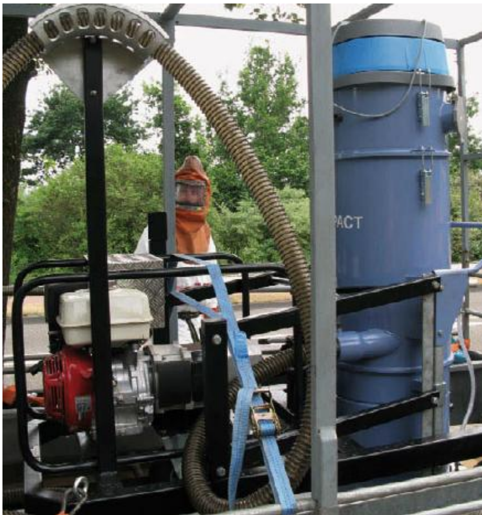
Ausführende Mitarbeiter müssen bei der Ausführung die geeignete Schutzbekleidung tragen

Für Informationen über gesundes und sicheres Arbeiten im Agrar- oder im Naturbereich siehe http://www.stigas.nl .