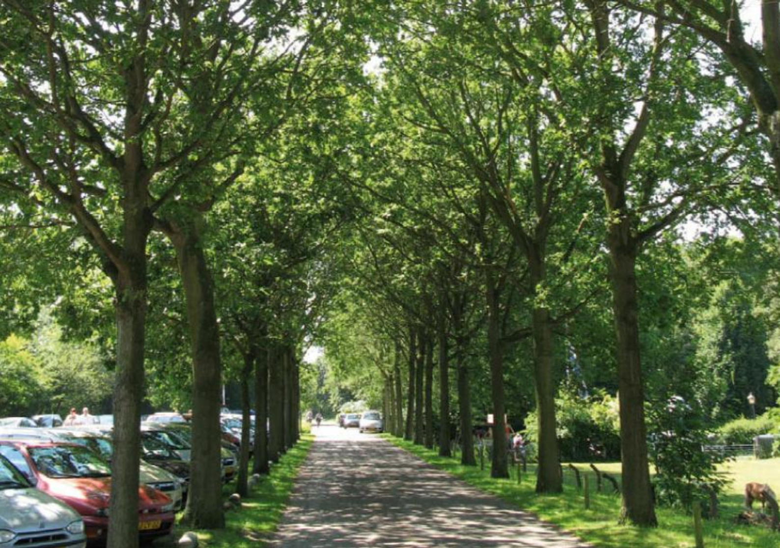
Parkplatz bei einer Naturlandschaft angrenzend an eine Gaststätte und Ponywiese: ein Risiko Gebiet.