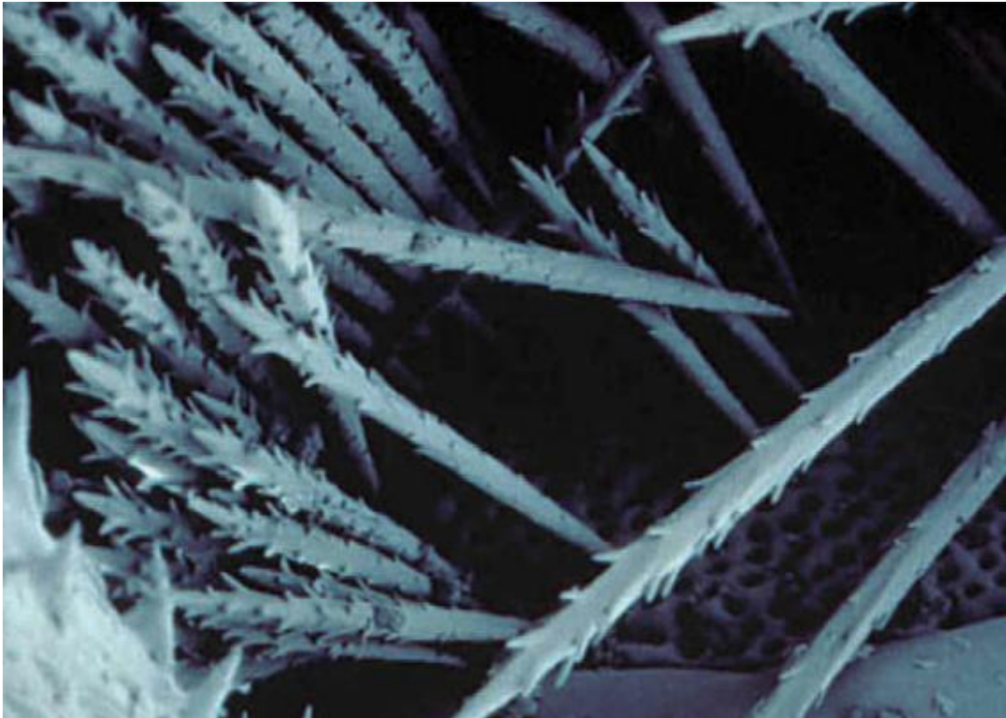
Vergrößerung der Brennhare (Bild: WUR-Alterra)

Gesundheitsbeschwerden entwickelt, die der Eichenprozessionsspinner verursacht 9 . Diese Richtschnur unterstützt die Rolle der GGD bei der Problematik. Die GGD richtet sich mit Ratschlägen an Gemeinden, klärt auf über Gesundheitsrisiken, über die Kommunikation mit der Öffentlichkeit, sowie über die Eindämmungsmaßnahmen. Daneben hat die GGD die Aufgabe, Bürger über Gesundheitsaspekte, die Behandlung der Beschwerden und deren Vorbeugung zu informieren.