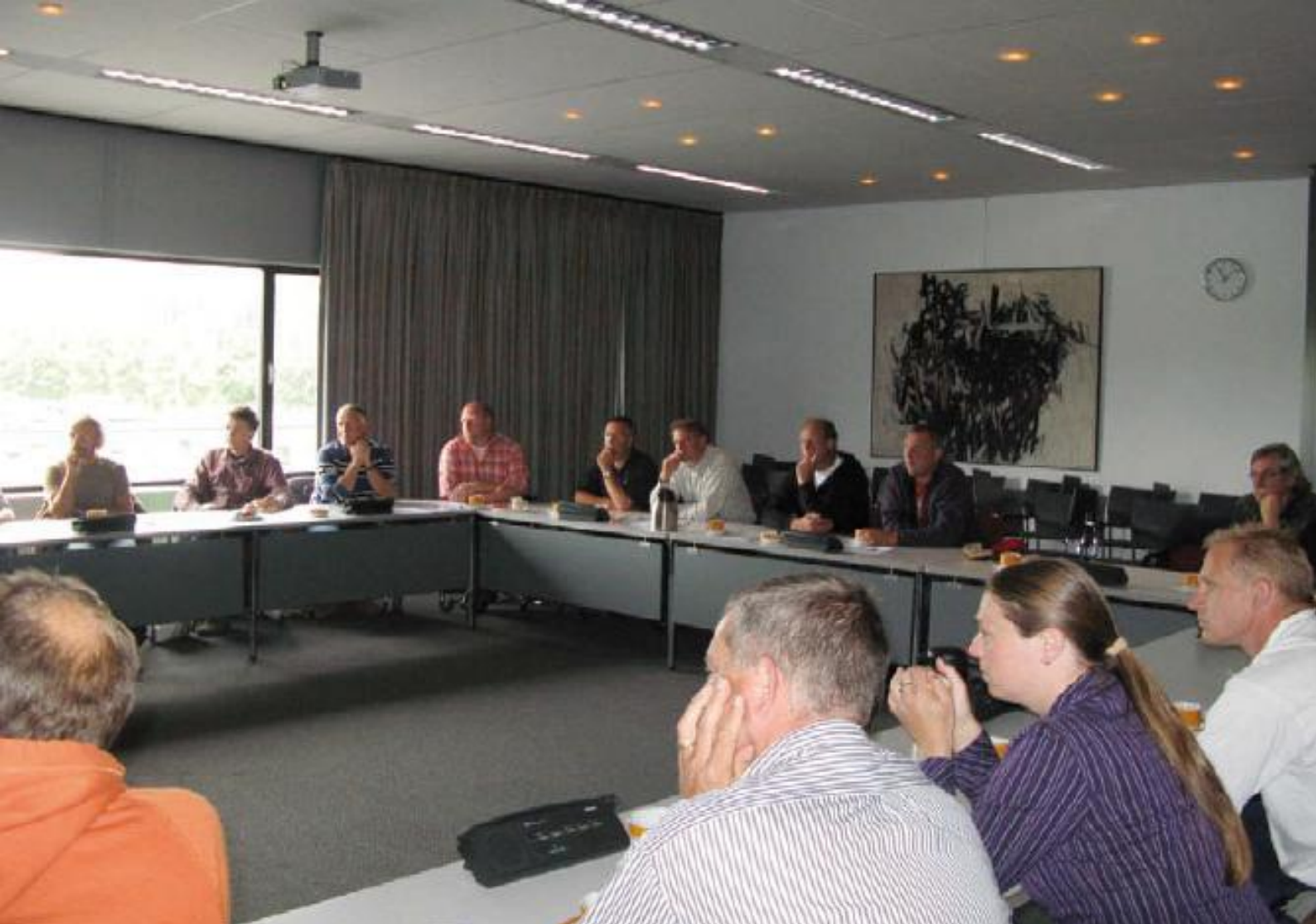
Erfahrungsaustausch zwischen Gemeinden