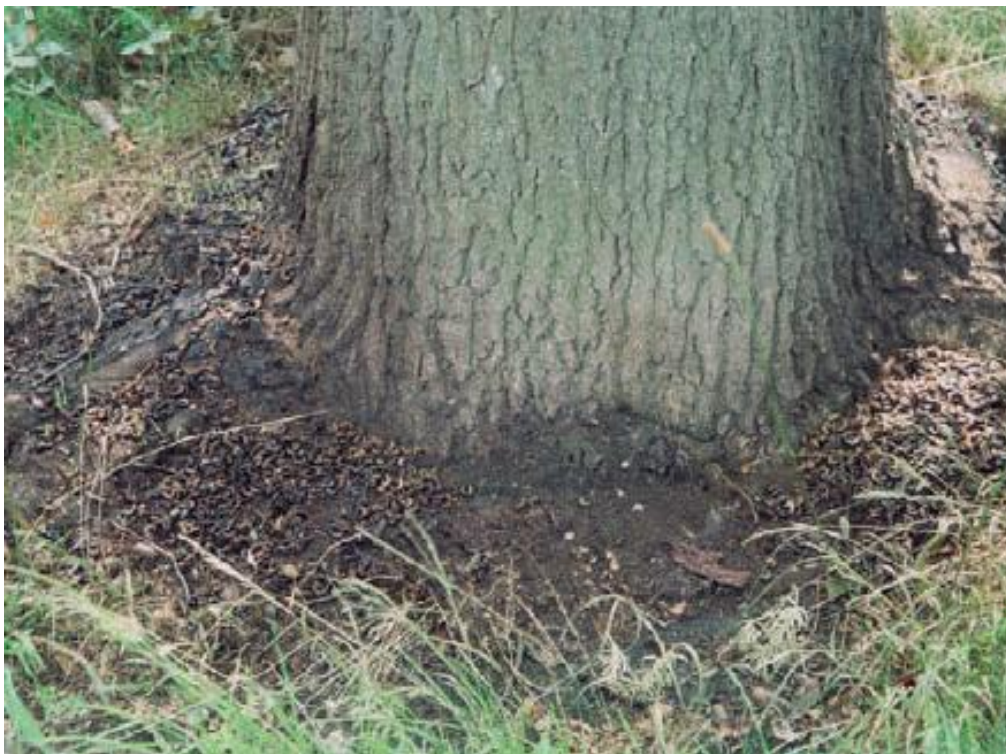
Abgebrannte Raupenrückstände am Straßenrand

Diese Rückstände werden langsam, auf natürliche Weise abgebaut und in den Boden ausgespült. Die Brennhaare können aber im Boden noch lange Zeit intakt bleiben. Umgraben der Erde kann deshalb nachträglich zur Freisetzung der Brennhaare führen.