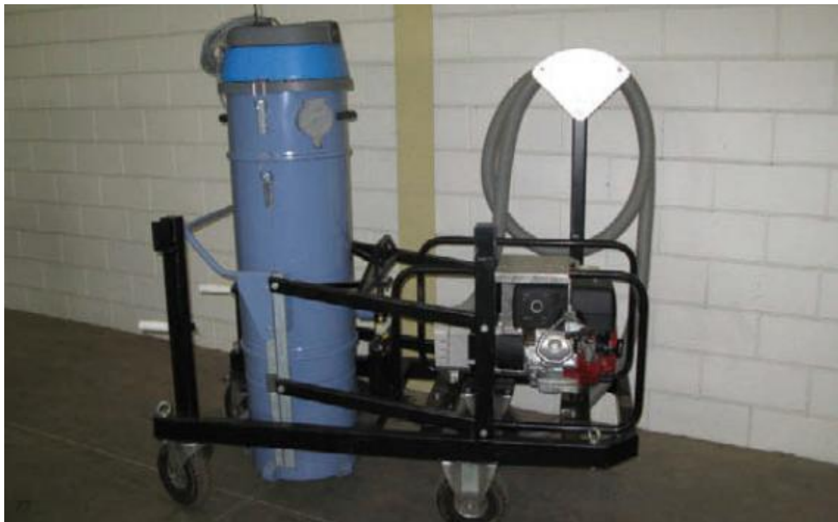
Handliche kleine Saugereinheit für schwieriges Gelände oder zum Einsatz auf einer Hebebühne.

Eine Überdruckkabine kann auch auf einer Hebebühne befestigt werden. Solche Einheiten bieten viele Möglichkeiten, weil sie leicht zu transportieren sind, man damit einfach auf größeren Höhen arbeiten kann und sich außerdem die Arbeitsbedingungen verbessern.