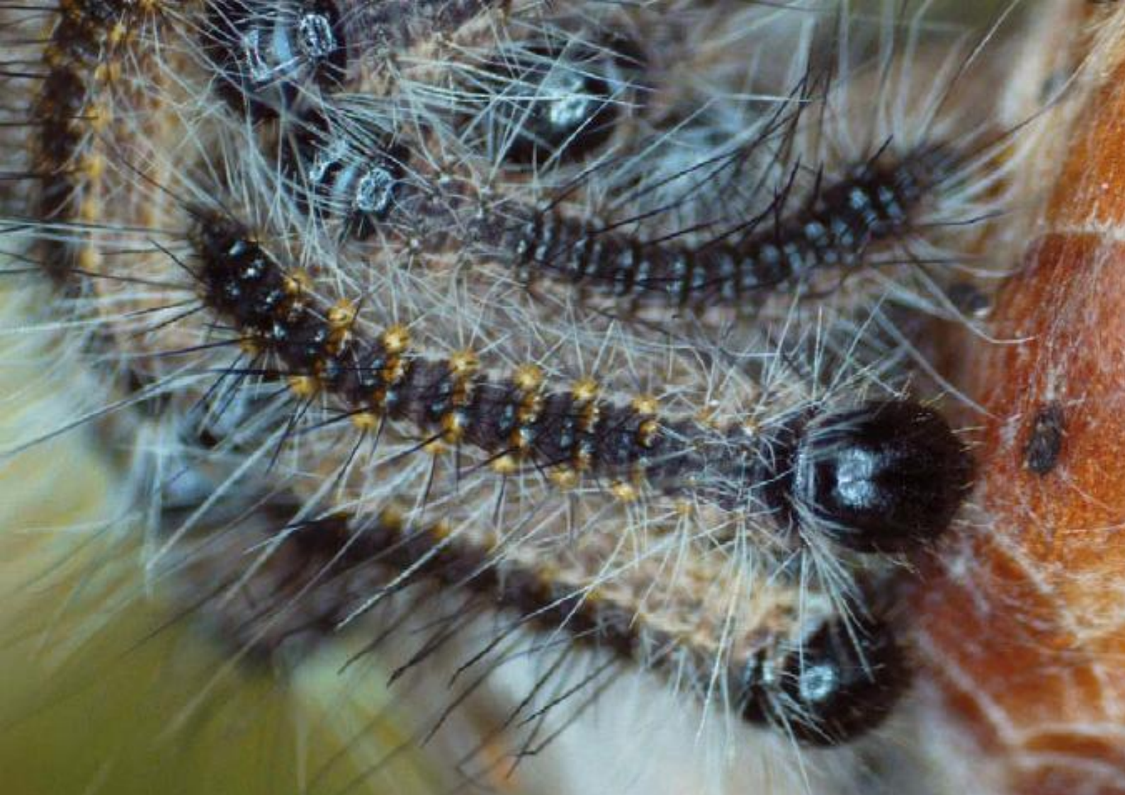
Junge Eichenprozessionsspinner